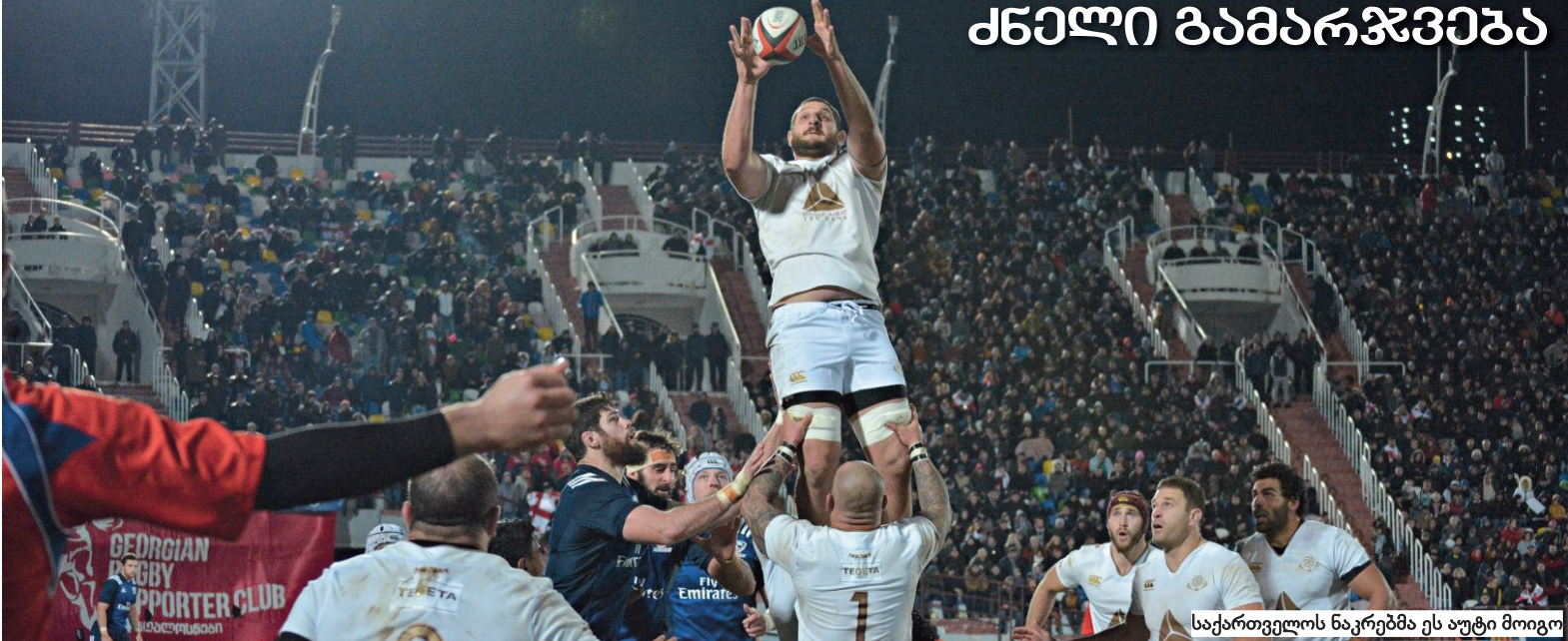
საქართველოს ნაკრებმა ეს აუტი მოიგო