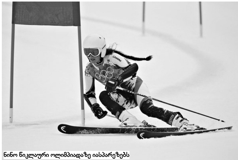
ნინო ნიკლაური ოლიმპიადაზე იასპარეზებს

საბჭოთა პერიოდში ფრისტილის სკი კროსის დისციპლინაში საქართველოს ნაკრების წევრმა დავით თელიაპურმა 7-იდან 25 ნოემბრამდე ავსტრიაში პიტცტალის მყინვარზე მდებარე სათხილაპურ ბაზაზე გაიარა სანვრთნელი შეკრება. სპეციალური მომზადების შემდეგ იგი იქვე ორი დღის განმავლობაში საერთაშორისო ფედერაციის ეგიდით გამართულ ავსტრიის თასის გათამაშებაში (სკი კროსი) მონაწილეობდა. ასპარეზობის პირველ დღეს მან 67-ე ადგილი დაიკავა. კვარცხლბეკზე ავიდნენ: 1. იონას ლენერი (შვეიცარია), 2. კეინ დრუერი (კანადა), 3. ადამ კაჩერი (ავსტრია). მეორე დღეს ქართველმა სპორტსმენმა ხუთი საფეხურით წინ წაინია და შეჯიბრება 62 ადგილზე დაასრულა. პირველი ადგილი ისევ იონას ლენერმა დაიკავა. მეორე-მესამე ადგილები კანადელებმა - კრისტოფერ მაჰლერმა და კეინ დრუერმა განიწილეს.