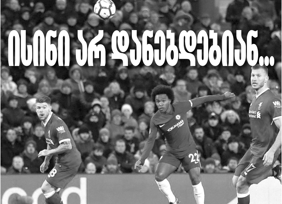
ნამიკ და ვილიანის დარტყმული ბურთი ლივერპულის კარში ჩაეგდება...