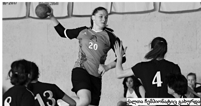
ქალთა ჩემპიონატის გახურდა