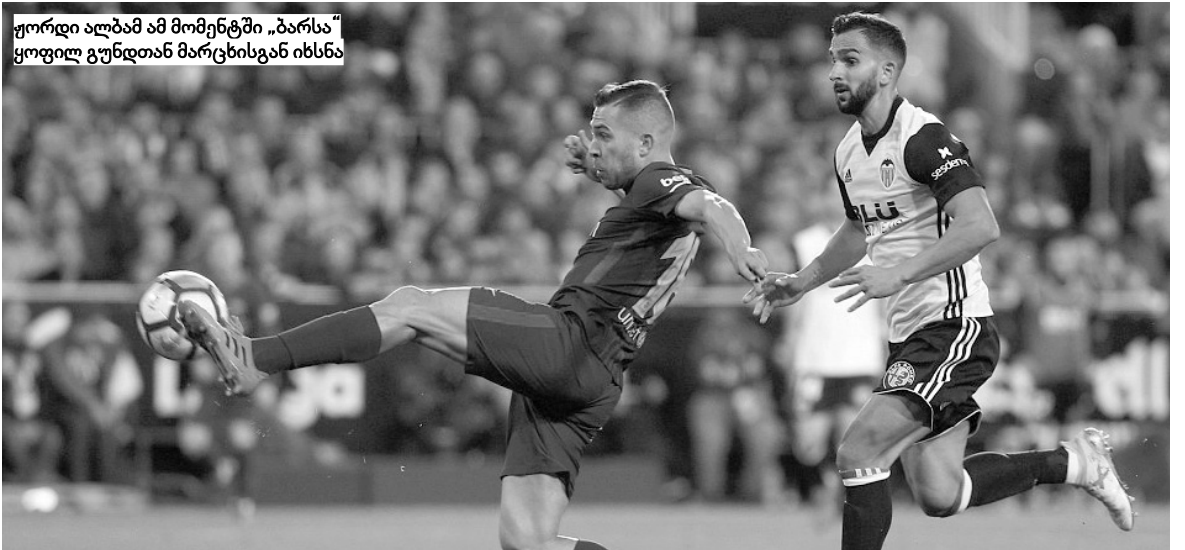
ფორდი ალბამ ამ მომენტში „ბარსა“ ყოფილ გუნდთან მარცხისგან იხსნა

სელა-ლაგანესი 1:0 გოლი: 1:0 ასპასი (27-პენ) ალაგასი-ვიტორია 1:2 გოლები: 0:1 ხორდანი (33), 0:2 პარლესი (69), 1:2 ბურგუი (91) გაყვებულნი: სანტოსი (45. ალაგესი), პარლესი (83. ეიბარი)