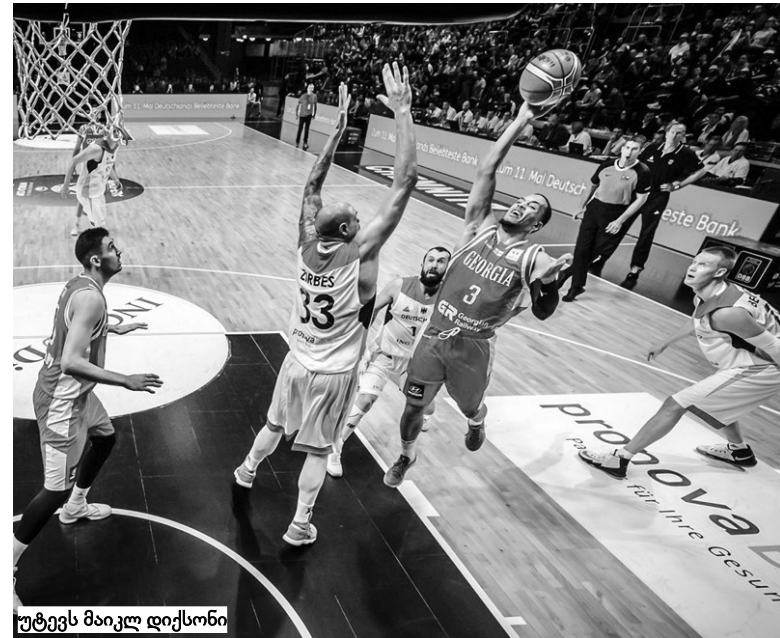
უტევეს მაიკლ დიქსონი

მომდევნო ეტაპზე გუნდებს ურთიერთშეხვედრებში მოგროვილი ქულები გადაწყვებათ. ვთქვათ, საქართველო-გერმანია-სერბეთი გასულიყვენ, გერმანიასთან სტუმრად მოგება გადავყვევოდა და თუ თბილისშიც დადებით შედეგს მივაყოლებდით, გერმანია უკვე ჩამოცილებული გვეყოლებოდა და დაგვრჩებოდა მეორე ჯგუფური ეტაპის სამ ნაკრებთან ბრძოლები. მეორე რაუნდში ჯგუფის 6-დან 3 საუკეთესო გადის მსოფლიოს თასზე.