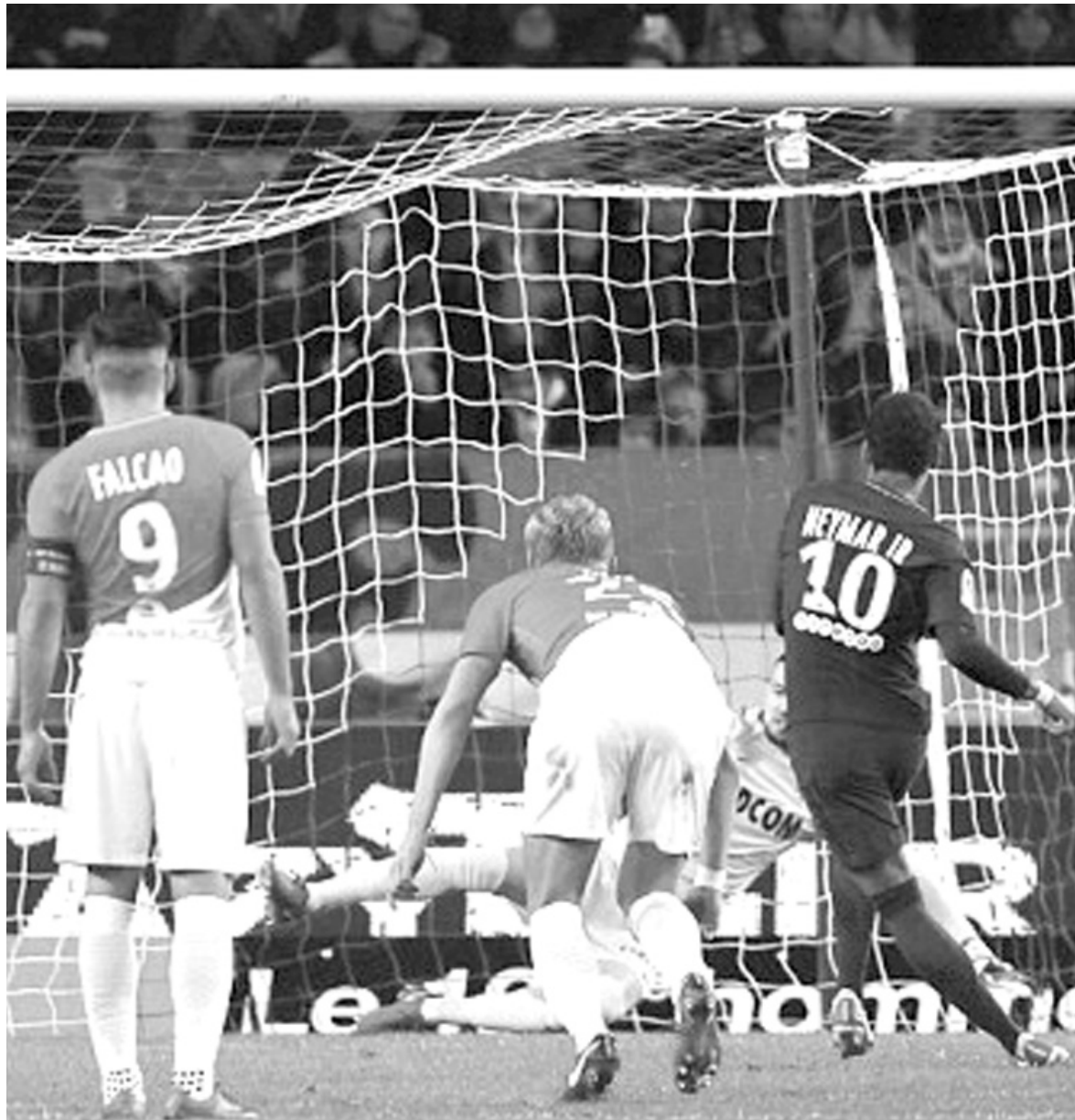
ამჟერად ბენალტი ნეიმარი შეასრულა

შეიძლება თუ არა ითქვას, რომ საფრანგეთის ჩემპიონის ვინაობა უკვე ცნობილია? ალბათ, საამისოდ ძალიან ადრეა, მაგრამ "პარი სენ-ჟერმენმა" წუხელ "მონაკოს" მისაყვამოვადან 2:1 მოუგო და დენის ხალისი გაუნელა. 14 ტურის შემდეგ მულტივარსკვლავური პსუ უკვე 9 ქულით უსწრებს "მონაკოს".