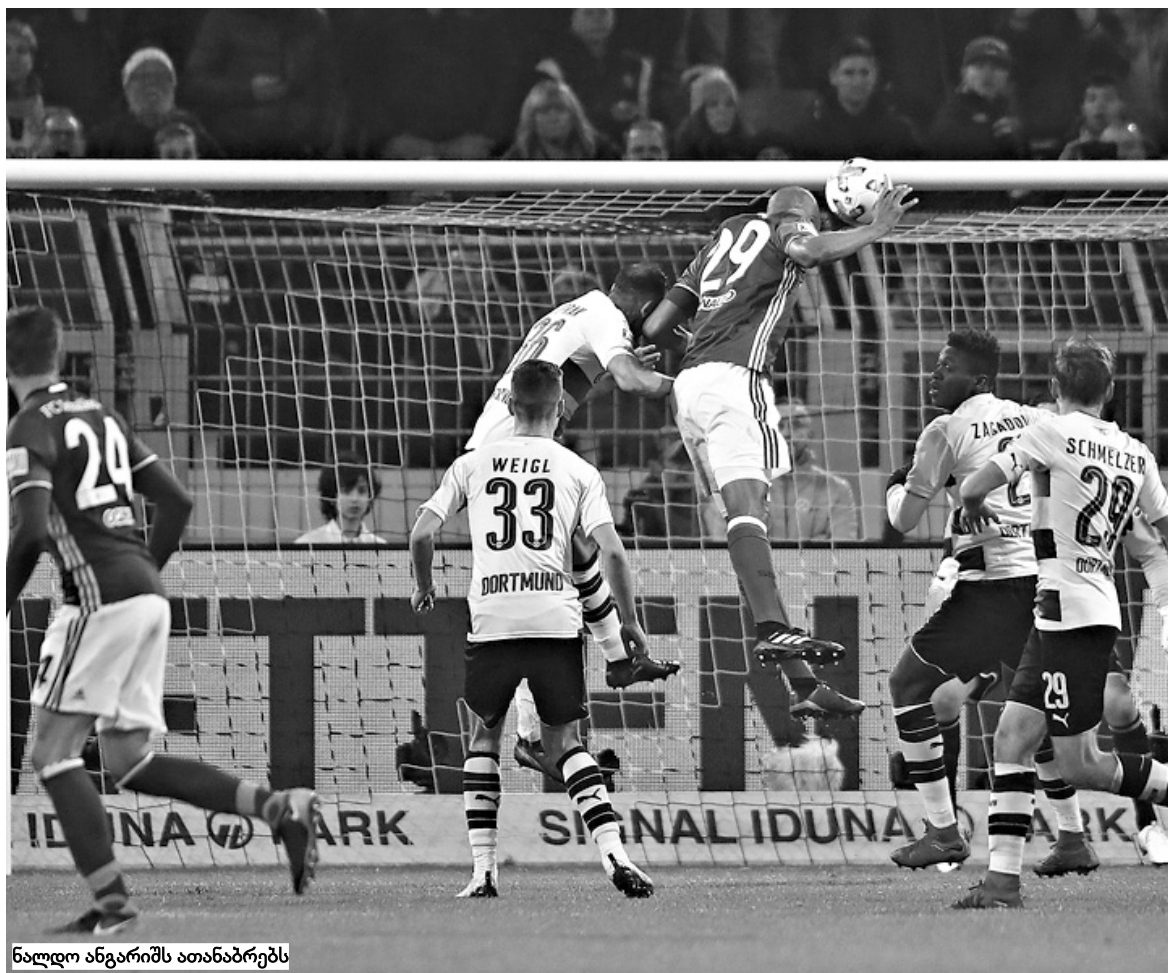
ნალდო ანგარიშს ათანაბრებს