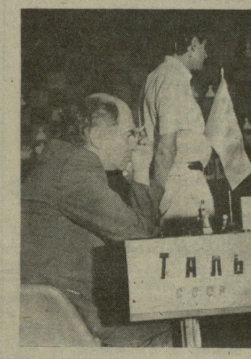
საქართველოს ტურნირების ახალი რეგლამენტით პირველ ორმოც სულზე თითოეულ მონაწილეს მოსაფიქრებლად ორი საათი ეძლევა. შემდეგ — კიდევ თითო საათი მომდევნო ოც სულზე, პარტიის გადადებად. ასეთ შემთხვევებში

მართალი ხალხი მადლიერების გრძობითაა გამსჭვალული ღვაწლმოსილი მოქალაქის, პირველი ქართველი ოსტატის ვიქტორ გოგლიძისადმი. ამის ხათელი დადასტურებაა მისი სახელობის მეგობრების ჩატარება, რომელსაც 1969 წელს ჩაეყარა საფუძველი. ამ საერთაშორისო ტურნირმა საქვეყნო აღიარება მოიპოვა. მეგობრული დიდი ინტერესით მონაწილეობენ ცნობილი მოქალაქეები. ბევრმა სწორედ აქ სრულყო თავისი თამაშის კლასი. რა თქმა უნდა, მათ შორის ჩვენი თანამემამულეებიც არიან. თვალს თუ გადავავლებთ წინა შეიდი მეგობრების ცხრილებს, დაგვრწმუნდებით, რომ პრიზიორთა შორის ყოველთვის არიან საქართველოს მოქალაქეები.