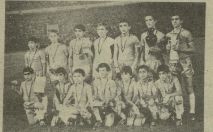
გარდაბნის ნორჩ ფეხბურთელთა გუნდი „ენერგეტიკოსი“.

მისასვლელი გზა „ენერგეტიკოსმა“ ტრიუმფით გაიარა, დაამარცხა ისეთი მეტოქეები, როგორებიცაა ყაზახეთის „სატურნი“ 5:0, ლატვიის „სოკოლი“ 4:1, ხაბაროვსკის „სპარტაკი“ 2:0, შემდეგ მეოთხედღონალში მოუგო ქ. ორიოლის „ტაიფუნს“ 3:1, ნახევარფინალში