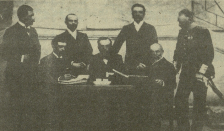
საერთაშორისო ოლიმპიური კომიტეტის პირველი შემადგენლობა.

საბჭოთა სპორტსმენებმა პირველად 1952 წლის ჰელსინკის ოლიმპიადის მიიღეს მონაწილეობა. მას შემდეგ ჩვენმა ოლიმპიელებმა ზაფხულის თამაშებში 878 მედალი მოიპოვეს, მათ შორის 340 ოქროს, 288 ვერცხლის და 250 ბრინჯაოს.