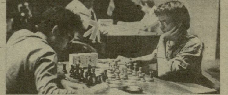
სურათზე: იგორ ნოვიკოვისა (სსრ კავშირი) და სტიუარტ კონკუესტის (ინგლისი) შეხვედრის მოხსენი.

უაციაში, რამდენიმე ზუსტი სვლით შეძლო პოზიციის გათანაბრება, გაცივლა ფიგურები და 27-ე სვლაზე აშკარად თანაბარ პოზიციაში მოწინააღმდეგეში დახვდნენ. ამ ტურის დანარჩენი პარტიები ასე დამთავრდა: რომანიშინი-გუფელი — 1:0, კოქული-შნაბიკი — 0:1, ვადილო პრანდშეტერ-ზაინიკის პარტია, რომელშიც სპეციალისტების აზრით ყვიმია მისალოდელი. VII ტურში პირველი დამარცხება იწვნია მსოფლიოს ექსპერტის მ. ტალმა კონკუესტთან შეხვედრაში. შეტოქეებმა ესპანურ პარტიაში ჰიგორის ვარიანტი გაითამაშეს. ტალმა შედარებით მშვიდი ვაგარძელა აირჩია. შეიქმნა შთაბეჭდილება, რომ თეთრებმა თითქოს უპირატესობას მიადნეს, მათ ფიგურებს მეფის ფრთაზე აქტიური განლაგება იერიშის წამოწყების კარგ პერსპექტივას უქადა. ტალი გადამწყვეტი იერიშის ძებნაში ცვატრტში მოექცა, გამორჩა ელემენტარული ტაქტიკური კომბინაცია, რის შემდეგაც უზარისხოდ დარჩა და მალე თავი დამარცხებულად სცნო. ამ ტურის დანარჩენი პარტიები ასე დამთავრდა: ნოვიკოვი-კოქული — 1:0, ზაინიკი-ლუკოვი — 0:1, უბილა-რომანიშინი — 0,5:0,5, გუფელი-პრანდშეტერი — 0,5:0,5. ამრიგად, 7 ტურის შემდეგ ლიდერთა ჯგუფის ასე გამოიყურება: ოლეგ რომანიშინი — 5, ვალენტი ლუკოვი (ბულგარეთი) — 4,5 (6 შეხვედრიდან) ალექსანდრე შნაბიკი (პოლონეთი) — 4 (6-დან), სტიუარტ კონკუესტი (ინგლისი), ელიზბარ უბილა — 3,5-3,5 (6-დან).