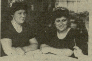
სის ინტერნაციონალური კოლექციის წარმომადგენლები მუდამ გულისხმიერად მასპინძლობენ მსოფლიოს სპორტის გამოჩენილ წარმომადგენლებს.

ბობს ბერძენი ქალი ნელი სოტირიდი და დასძინს: განა შეიძლება სპორტსმენს ყოველწლიურად რამდენიმე კვირის განმავლობაში დღეში სამჯერ-ოთხჯერ ხვდებოდეს და მისი გულშემატკივარი არ გახდეს?