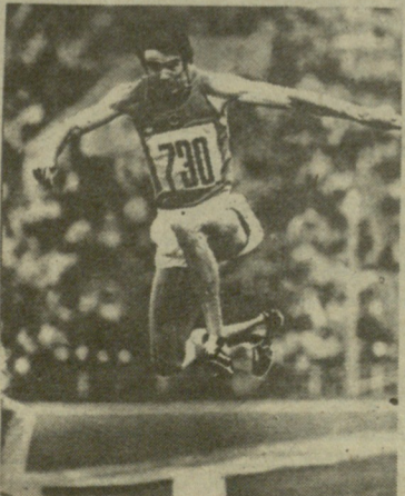
ვიქტორ სანეევი მოსკოვის XXII ოლიმპიადებზე.

1980 წ. ლიანა ცოტაძე (წყალში ხტომა), ნიკოლოზ დერიუგინი (ჯალათბურთი), ალექსანდრე ჩივაძე (ფეხბურთი), თენგიზ სულაქველიძე (ფეხბურთი), რევაზ ჩელგაძე (ფეხბურთი).