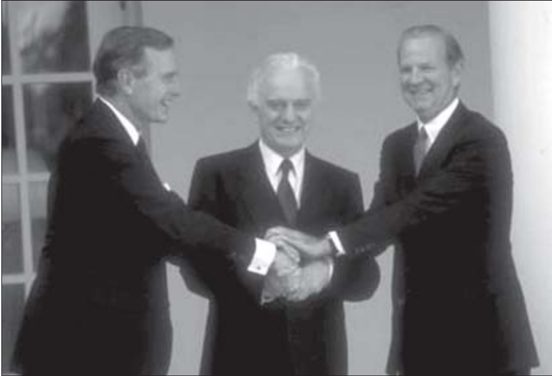
აშშ პრეზიდენტი ჯორჯ ბუში, ედუარდ შევარდნაძე და აშშ სახელმწიფო მდივანი ჯეიმს ბაიკერი