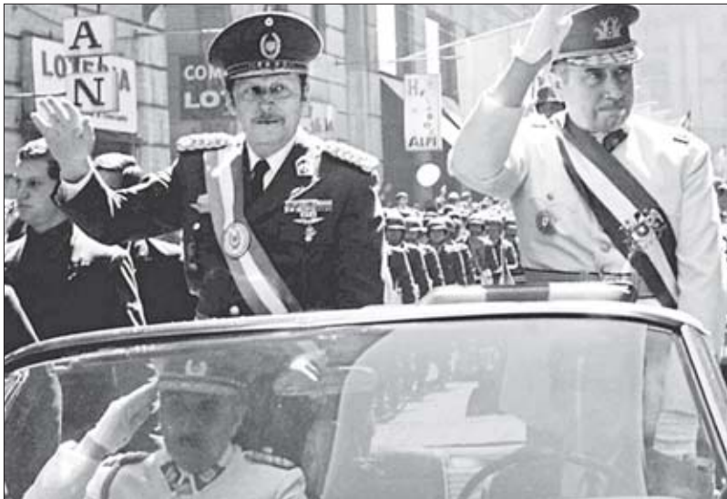
სტრესნერი სტუმრად პინოჩეტისთან