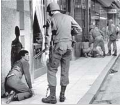
სიკვდილის ესკადრონები არგენტინაში