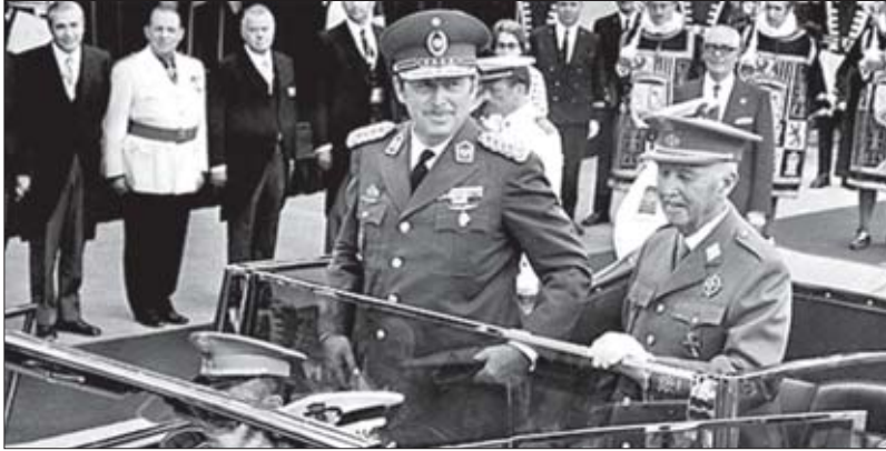
ალფრედო სტრესნერი და ფრანსო მადრიდში, 1973 წელი

რობაშიც უკმაყოფილოთა რაოდენობა დღითიდღე იზრდებოდა. ქვეყანაში, რომელსაც სტრესნერი ლათინურ ამერიკაში ყველაზე მშვიდ სახელმწიფოს უწოდებდა, საპროტესტო გამოსვლები დაიწყო და მარტო რეპრესიებით მათი შეჩერება ვეღარ მოხერხდა.