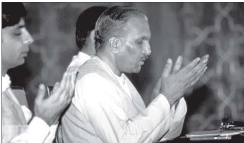
ზია ულ-ჰაკი ლოცვის დროს

რი და პირსისხლიანი მკვლელი. გარდაცვალებისთანავე იგი მყისვე დაივიწყეს მხოლოდ მათ, ვინც გენერალი თავის გეოპოლიტიკურ კომბინაციებში გამოიყენა.