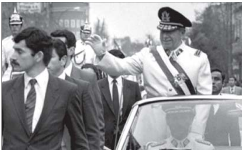
განერალი ჰინოჩატი სანტიაგოს ქუჩაზე

ბა) მიმართულია იქითკენ, რომ კავშირის არხები ღია იყოს. ჩვენ არ დავარღვევთ ტრადიციულ ურთიერთობებს. ჩვენ იქიდან გამოვდივართ, რომ საერთაშორისო უფლებები და მოვალეობები შესრულდება და დაცული იქნება. ასევე, ვაღიარებთ, რომ ჩილეს ხელისუფლების ქმედებები, პირველ რიგში, მისი საკუთარი მიზნებით განისაზღვრება“. ასე ამბობდა 1971 წლის 25 თებერვალს აშშ-ის პრეზიდენტი რიჩარდ ნიქსონი.