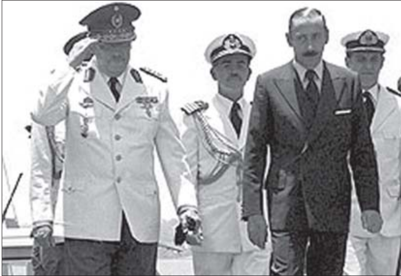
ალფრედო სტრესნერი და სორხე ვიდელა

იყო, სწორედ სტრესნერის მმართველობის ხანაში იქცა მეტ-ნაკლებად სტაბილურ ქვეყნად, — აღნიშნავდა ამერიკელი ისტორიკოსი ბენ საიქსი. ქვეყნის ეკონომიკურ განვითარებას ხელი შეუწყო ორმა გარემოებამ: ალფრედო სტრესნერი აშშ-ის ერთგული იყო, რაც არაერთხელ დაამტკიცა, თუმცა განსაკუთრებული სიმპათია მაშინ დაიმსახურა, როცა დომინიკის რესპუბლიკაში ამერიკელების შეჭრისას დასახმარებლად პარაგვაის ჯარები გაუგზავნა. მოგვიანებით სტრესნერი ლათინური ამერიკის თითქმის ყველა დიქტატორულ რეჟიმს დაუმეგობრდა (პარაგვაის მომიჯნავე ქვეყნების გამოკლებით). მხარდაჭერისთვის აშშ-მა პარაგვაი კმაყოფაზე აიყვანა.