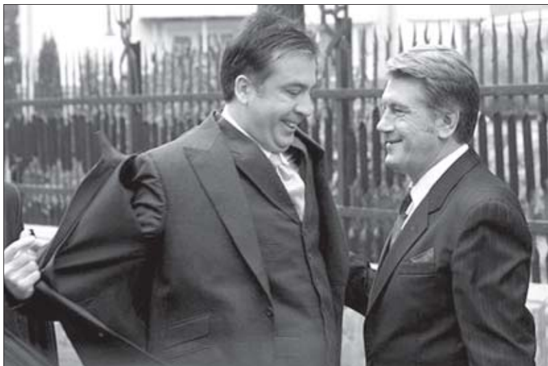
ვიქტორ იუშჩენკო და მიხეილ სააკაშვილი

დი სამამულო ომის ფრონტებზე, 2,5 მილიონი მეგრძოლი და-ჯილდოებული იყო ორდენებითა და მედლებით, 2 ათას მეგრძოლს საბჭოთა კავშირის გმირის წოდება მიენიჭა. იუშჩენკომ მათ ხსოვნას უღალატა და „ОУН-УПА“-ს ვეტერანებზე გაცვალა, რომლებიც ჰიტლერის მხარეზე იბრძოდნენ და მათ გულისმოსაგებად „ჰოლოკოსტის“ პოლიტიკას ატარებდნენ.