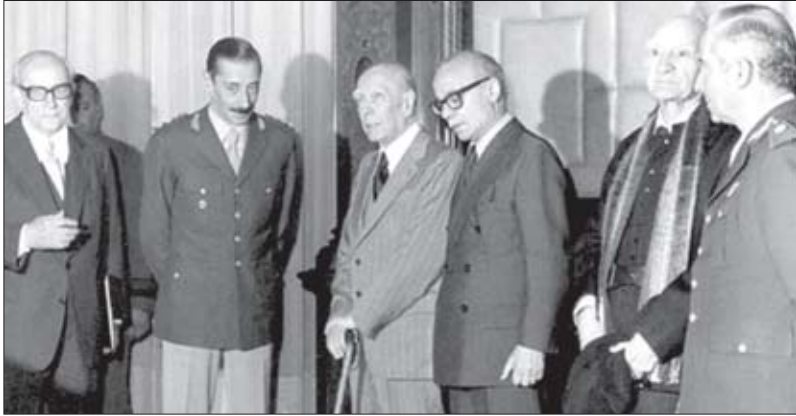
ვიდელა-საბატო-პორსენის შეხვედრა სავანში

სჭვალული და ნაციისა და ქვეყნის მოსახლეობის ყველაზე წმინდა ინტერესებით იხელმძღვანელებს“. სინამდვილეში ამ ერთი შეხედვით კეთილშობილური ლოზუნგის მიღმა ნამდვილი ტერორი იმალებოდა.