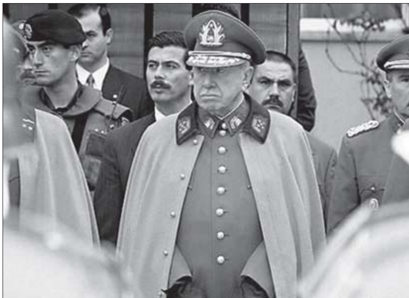
გენერალი აუგუსტო პინოჩეტი

პინოჩეტის ცხოვრებაში იყო ისეთი მომენტებიც, რომლებიც მას კოლეგებისგან მაინც გამოარჩევდა. ჩილელ გენერალთაგან ცოტას თუ ჰქონია სამეცნიერო გამოკვლევები, პინოჩეტი კი ავტორია მონოგრაფიებისა: „გეოპოლიტიკა“ და „ომი წყნარ ოკეანეში. 1879 წელი“.