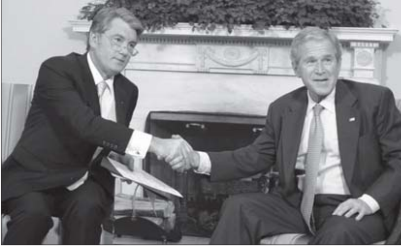
ჯორჯ ბუში და ვიქტორ იუშჩენკო

ლურად ცნეს უკრაინის მესამე პრეზიდენტად. იმავე დღეს „უმ-აღლეს რადაში“ საზეიმო სხდომა გაიმართა ქვეყნის ახალი მეთაურის ფიცის მიცემასთან დაკავშირებით.