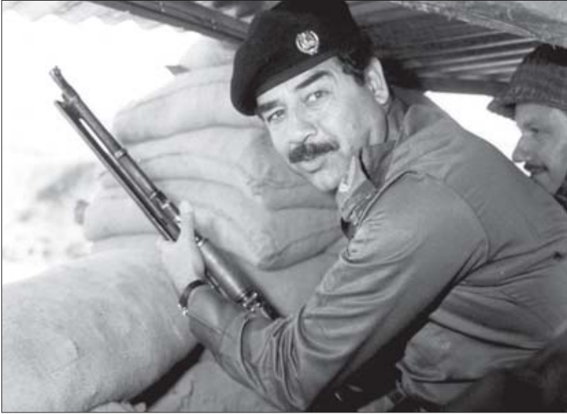
სადამ ჰუსეინი სამხედრო სწავლებისას

და მომავალ „არაბი ერის რაინდს“, როგორც მას ერაცის მედია უწოდებდა, ძალაუფლების აკვიატებული იდეა ჩაუნერგა. სხვათა შორის, უკვე ვიცე-პრეზიდენტად ყოფნისას იგი გამოცდაზე ქამარში გარჭობილი პისტოლეტითა და ოთხი შეიარაღებული მცველით გამოცხადდა. ცხადია, გამომცდელებმა ზედმეტ ფორმალობებს თავი აარიდეს.