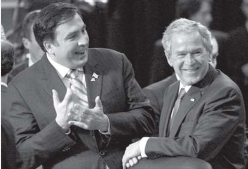
მიხეილ სააკაშვილი და ჯორჯ ბუში

სიტეტი გარკვეული მნიშვნელობით აშშ-ის ბაზაა სტუდენტთა გადასაბირებლად. 1994 წელს სააკაშვილი სამართლის მაგისტრის ხარისხს იღებს. 1995 წელს კი, ჯორჯ ვაშინგტონის უნივერსიტეტში დაიცვა ხარისხი. შემდეგ ევროპული სამართლის განხრით სტაჟირება გაიარა ფლორენციასა და ჰააგის საერთაშორისო აკადემიებში.