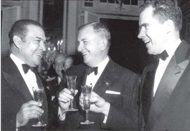
რიჩარდ ნიქსონი და ბატისტა 1954 წელს ნიქსონის კუბაში ვიზიტისას

მდიდრდებოდა გზების, სასტუმროებისა და გასართობი დაწესებულებების მშენებლობით. ყვეოდა კორუფცია, საზოგადოებაში სულ უფრო ღრმავდებოდა უფსკრული მდიდრებსა და ღარიბებს შორის.