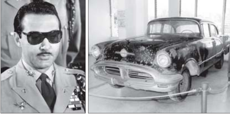
რაფაელ ტრუხილიო და მისი კილინგის ოლდსმობილი

ერთი მნიშვნელოვანი შენიშვნა: 1916 წელს დომინიკის რესპუბლიკაში, რომელიც ათი წლის მანძილზე პრაქტიკულად ვაშინგტონის სრული გავლენის ქვეშ იყო მოქცეული, შეიყვანეს აშშ-ის საზღვაო ქვეითთა დანაყოფები. პირველივე დღეებიდან თავიანთ კონტროლს დაუქვემდებარეს ეროვნული პოლიცია, რომლის მეშვეობითაც სასურველ წესრიგს ამყარებდნენ ამ ქვეყანაში, ანესრიგებდნენ ძალაუფლებისთვის მებრძოლი დაჯგუფებებისა და კლანების ბრძოლას. სწორედ მაშინ მოექცა ტრუხილიო ამერიკელთა თვალსაზრისში, რომლებმაც შესაბამისად დააფასეს მისი მონდომება და ხელი შეუწყვეს მის კარიერას: იგი გააგზავნეს აშშ-ში ექვსთვიან კურსებზე ერთ-ერთ სამხედრო სკოლაში. ამ კურსების დამთავრების შემდეგ იგი პოლიციის უფროსი გახდა.