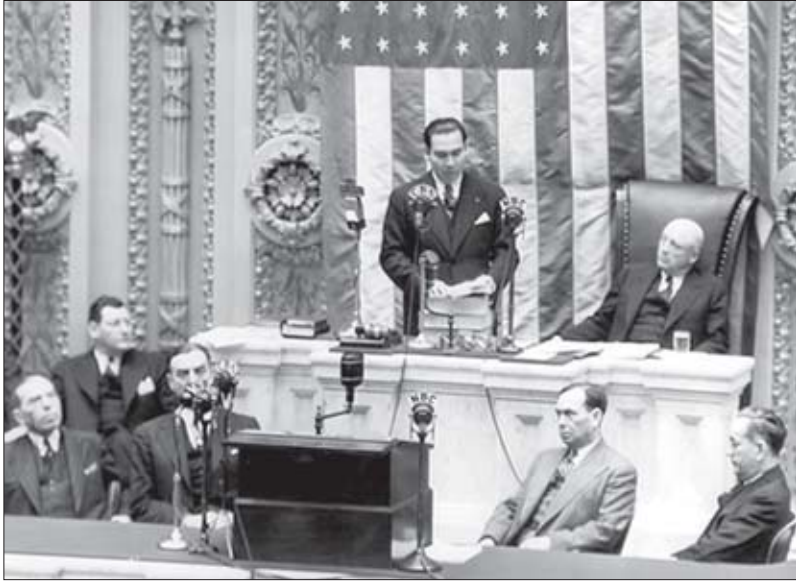
ბატისტა აშშ-ის კონგრესში გამოსვლისას, 1952 წ.

სი ქონების შესახებ ზუსტი მონაცემები ამ დრომდე უცნობია. სამაგიეროდ, როგორც ერთი გაზეთი წერდა, მისი ძვეყანა ჰგავდა „უზარმაზარ ციხეს, სადაც ყველა მოქალაქეს დანა ჰქონდა ყელზე მიბჯენილი“ . სასიკვდილოდ ნაწამებთა რაოდენობა 20 000-ს აჭარბებდა.