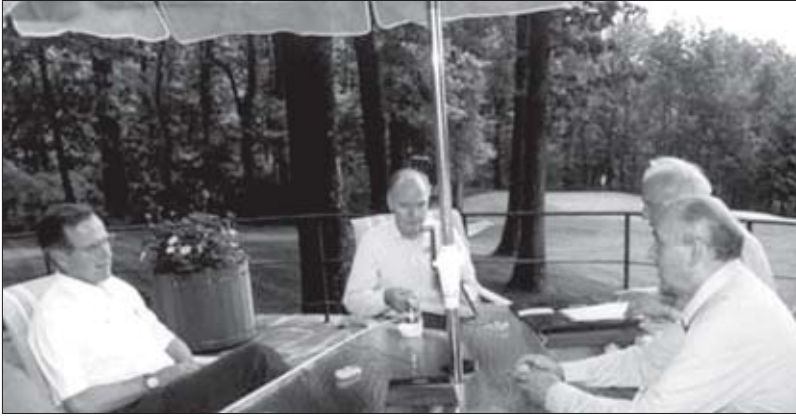
ჯორჯ ბუში, ბრენტ სკოუპროფტი, ელზარდ შევარდნაძე და მიხეილ გორბაჩოვი

თან“, გმირთა მოედნის მისადგომებთან და მარჯანიშვილის მოედანზე.