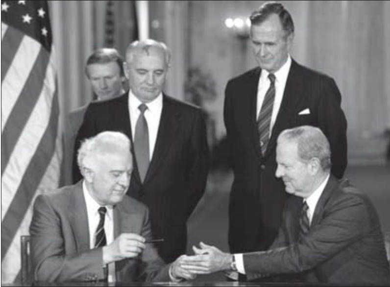
1990 წლის სამიტი. სსრკ პრეზიდენტი მიხეილ გორბაჩოვი, აშშ პრეზიდენტი ჯორჯ ბუში, ელზარდ შივარდნაძე და აშშ სახელმწიფო მდივანი ჯეიმს ბეიკერი

დინს გადააჭარბა. ქავთარაძე უმალ მოიშორეს, მისი ადგილი კი შევარდნაძემ 1965 წელს დაიკავა. ახალმა ხელმძღვანელმაც მაშინვე საქმეს მოჰკიდა ხელი. საქართველოში დღემდე იხსენებენ, თუ როგორ წმენდდა იგი სამართალდამცავ ორგანოებს „სამხრეებიანი მაქციებისაგან“ და რამდენი გამოემშვიდობა მუნდირს. ხმაც კი დაირხა, რომ ადგილობრივი მაფია ფულს აგროვებს შევარდნაძის კარიერული წინსვლის უზრუნველსაყოფად, რაც შეიძლება მალე, მოსკოვში მის გადასაყვანად.