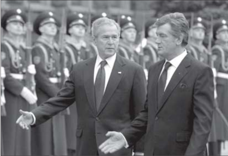
ვიქტორ იუშჩენკო და აშშ-ის პრეზიდენტი ჯორჯ ბუში

ბრწყინვალე ეკონომისტი, რომელმაც უკრაინისათვის რეკორდულ ეკონომიკურ ზრდას მიაღწია. მაგრამ მაშინ ცოტამ თუ იცოდა, რომ 90-იანი წლების დასაწყისში „ბრწყინვალე ეკონომისტმა“ მილიარდობით დოლარი გაიტანა ქვეყნიდან. ოპონენტები, პირველ რიგში, უკრაინელი მემარცხენეები და რუსეთთან კავშირის მომხრეები, დღეს ექსპრეზიდენტს „დასავლეთის აგენტს“ ეძახიან. მათი არგუმენტები საკმაოდ თვალსაჩინოა — ამერიკული ადმინისტრაციის აქტიური მხარდაჭერა იუშჩენკოსადმი.