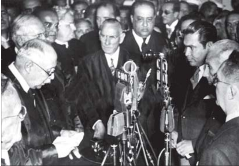
1940 წლის 24 ოქტომბერს კონსტიტუციით არჩეული კუბალი დიქტატორი ფულხენსიო ბატისტა-ი-სალდივარი თავის ოფისში ფიცს დებს

ლეგი მათ სიამის ტყუპებს უწოდებდნენ. 1935 წლის მარტში კვლავ დაიქაბა მდგომარეობა. ამჯერად გაფიცვაში 700000 ადამიანი მონაწილეობდა, მაგრამ ბატისტამ გაფიცულების დახმარების ნებაართვა გაცა.