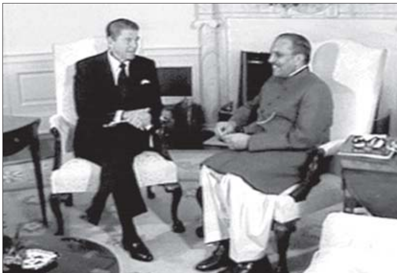
ზია ულ-ჰაკი და აშშ-ის პრეზიდენტი რონალდ რეიგანი

სსრკ-მა და ინდოეთმა ამაზე 1971 წლის აგვისტოში 20-წლიანი თანამშრომლობისა და მეგობრობის შესახებ შეთანხმებაზე ხელმოწერით უპასუხეს. ხოლო იმავე წლის შემოდგომაზე აღმოსავლეთ პაკისტანში (ამჟამად დამოუკიდებელი ბანგლადეში) კულმინაციას მიღწია შეიარაღებულმა კონფლიქტმა. პაკისტანი ინდოეთს ორ ფრონტზე ეომებოდა: აღმოსავლეთში – ბანგლადეშში და დასავლეთში – ქაშმირში. 16 დეკემბერს პაკისტანის ჯარებმა კაპიტულაცია გამოაცხადეს აღმოსავლეთის ფრონტზე, ხოლო მეორე დღეს სამხედრო მოქმედებები დასავლეთის ფრონტზეც შეწყდა. აღმოსავლეთ პაკისტანმა არსებობა შეწყვიტა, ხოლო მსოფლიო პოლიტიკურ რუკაზე ახალი სახელმწიფო – ბანგლადეში წარმოიქმნა.