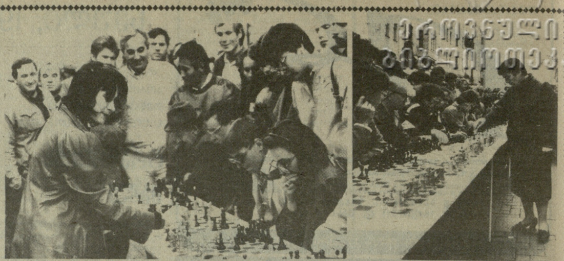
როზმარც ვიუწყებოლით, 11 სექტემბერს მოსკოვში, ძველ არბატზე, „ქალაქის დღის“ ზემის პროგრამით მოეწყო ერთდროული საქარაკო სეანსი, რომელშიც მონაწილეობდნენ საქართველოს საუკეთესო მოქალაქე ქალები და ვაჟები. საქართველოს მოქალაქეებმა გაიმარჯვეს 140 პარტიაში, 18 პარტია წააგეს, 17 კი უაბით დაშლად.