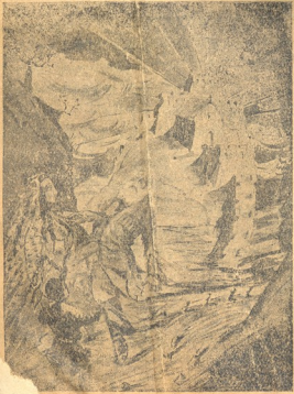
ბა ძველი, გოშარჯოს ახალსი (ნახატი ლ. გუდიაშვილისა)