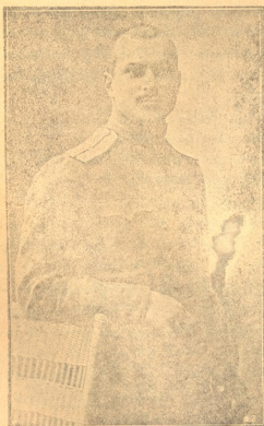
ნიკი ნიკიფ. მამ. მთავარი შვილი პრაპორჩიკი, მღე მამათავარი შვილის, შვილი ოსმალეთის ასპარეზზე ხელნართულ გმ: რულ ბრძოლაში ადფეთქეს ხელის ყუმბარით. 28 წლ. იყო.

უმაწვილს ქართული წიგნები მაგვეით. ასეთმა სსწავლამა უმაწვილი დიდად გაახარა და დიდი მადლობა გადაგვისხდა, ვინ იცის რამდენია ისეთი კარგი უმაწვილი გამაგმადიანებულს სსწართვლოში, დანატრულებულ ქართულს წიგნსა და წერა-კითხვას ცოდნას! ჩვენს ძმებს წიგნის ცოდნა სწეურათ, სწავლა-განათლება უნდათ და ჩვენ-კი არაფერს არ ვაკუთებთ სირცხვილა ჩვენთვის, ართვლებო. სირცხვილი! მაზირ