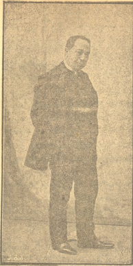
კოტე მესხი (1859—1914)