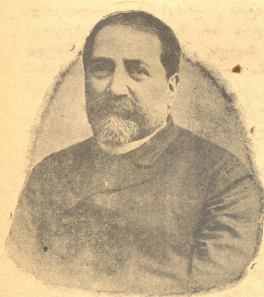
ილია ჭავჭავაძე (1837 — 1907 — 1917) გარდაცვალებიდან ათი წლის შესრულების გამო.