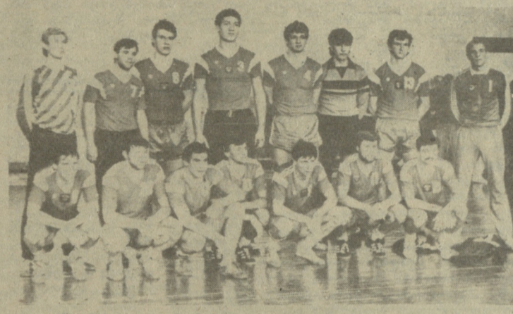
სსრ კავშირის პირველი ნაჯრები.