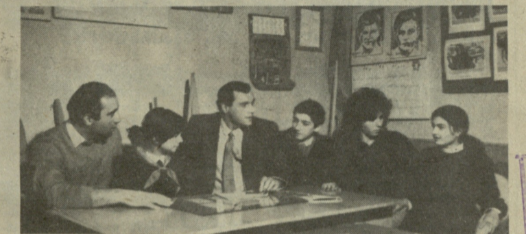
თბილისის 30-ე საშუალო სკოლის პედაგოგები და მოსწავლეები გულთბილი შეხვედრა მოუწყვეს სეულის XXII-ე ოლიმპიური თამაშების მონაწილეებს...