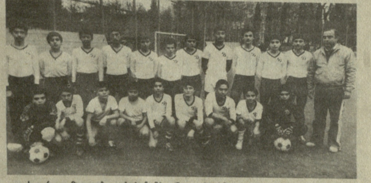
სურათზე: თბილისის ჩემპიონი „ნორჩი დინამოს“ მეორე გუნდი.

დამთავრდა თბილისის პირველობა 1975 წელს დაბადებულ ნორჩი ფეხბურთელთა შორის. ამ საინტერესო შეჯიბრებაში მონაწილეობდა ქალაქის სპორტული სკოლების 16 გუნდი.