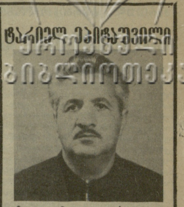
მოულოდნელად გარდაიცვალა ვეტერანი ფეხბურთელი, თბილისის „სპარტაკის“ ოსტატთა კოლექტივის ყოფილი მოთამაშე...