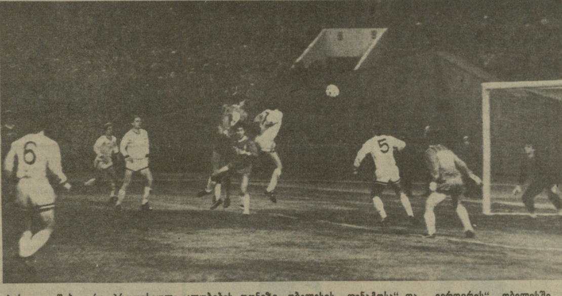
პირველი შეხვედრა პროფესიული კლუბების დონეზე. თბილისის „დინამოს“ და „ვერდერის“ თბილისში გამართული ამასწინადელი მატჩის ფრაგმენტი.

თბილისის „დინამოს“ საფეხბურთო კლუბის დამფუძნებელი კომუნარცია ჯერ არ ჩატარებულა, ანაბრის ნომერი არ გამოცხადებულა, მაგრამ კართული ფეხბურთის ფლავანის, თბილისის „დინამოს“ ვულფანგანკვანი და ცალკეული ორგანიზაციები რესპუბლიკის სხვადასხვა კუთხეში უკვე მზად არიან დაწყებინან. დენე კლუბი და პირად შენახანი საუკვეთი განუშადიონ ახალშენილ კლუბს, რომელიც ამიერიდან სრულ სამუშაოთა ანაბრისზე გადადის.