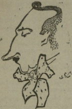
6. 6. ჩერქანინი (შარტი)

კონსერვატორიის დირექტორი და სახელმწიფო თეატრის ლოტბარი.