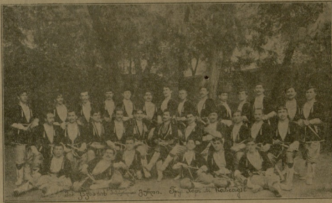
მ. კახიას სახალხო გუნდი (დაარ. 1910 წ.)

ამ ლექსში გაეგზავნება ბათუმს და სხვ. სამხედრო უწყ. კულტ. სექციის ინიციატივით ეროვნულ კონცერტების გასამართად.