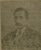
მირან ალექსი-ძე თოფჩიშვილი (მ. ხაიხელი) (1894—1920) გარდაიცვალა კიევიშ ა.წ. იანვარში.