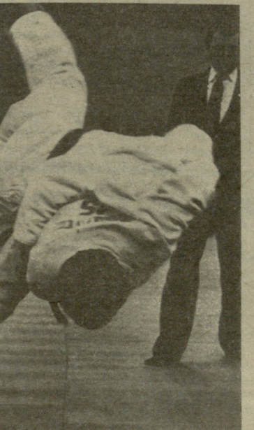
მარცხნივ) მოიპოვეს. საქართველოს მოქიდავეები (მარცხნივ) მეორე ადგილზე გავიდნენ.