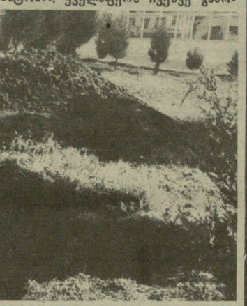
სრემის მთავორები სტადიონზე.

ალბათ, საინტერესოა ისიც, თუ რა ხარისხით კეთდება რემონტი. აღვნიშნავთ დათვალიერებამ საქმით ხარვეზები გამოავლინა. ამის შესახებ გვინდოდა ვაწვდომოდა გვეწერა, მაგრამ ზოგიერთმა მშენებელმა მტკიცე უნდა განიცადა და შემოგვითა კიდევ, დაგვაცადეთ, ბატონო, ყველაფერს ჩვენც გამო-