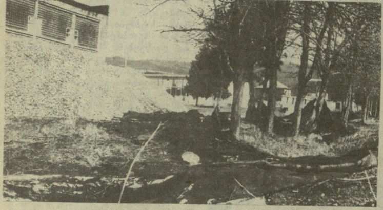
საცურაო აუზიდან გადმოფრთხილი სახურავი.

ამის შემდეგ ბევრი იფიქრებს, სად იყო მიწები კომისია და ბოლოს და ბოლოს სკოლის დირექტორს, ალბათ, ხელი არ მოაწერეს რემონტის დამთავრების აქტს. ამის შესახებ არაფერი მომხდარა, ხელიც მოაწერეს და მადლობის ნი-