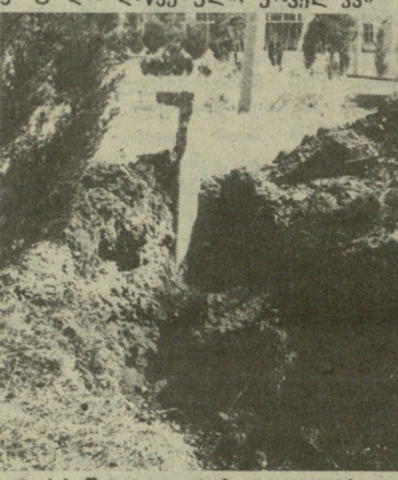
სრემის მთავორები სტადიონზე.

ახლა ჩამოვთვალოთ, ამ დროის განმავლობაში გემის მიხედვით ვინ რამდენი რაოდენობის თანხა აითვისა (ასათვისებელი თანხის რაოდენობა ფრჩხილებში). კომუნალური მშენებლობის სამინისტრო — 130 ათასი მანეთი (200 ათასი), თბილისკონსტრუქციის — 7 ათასი (40), ამიერკავკასიანსშენი — 25 ათასი (50), ავიამშენი — 20 ათასი (350), საქმთავარმონტაჟსშენი — 22 ათასი (200), სპორტსახკომი — 5 ათასი (50), ინდუსტრიამშენი — 102 ათასი (250), სახალხო განათლების სამინისტრო — 34 ათასი (60).