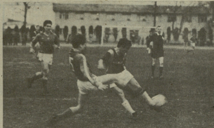
სურათზე: სსრ კავშირის პირველი ნაკრებისა და თურქეთის ნაკრების (მარცხნივ); საქართველოსა და უნგრეთის ფეხბურთელთა შეხვედრის მომენტები.