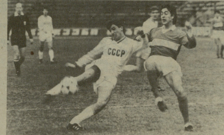
სურათზე: სსრ კავშირის პირველი ნაკრებისა და თურქეთის ნაკრების (მარცხნივ); საქართველოსა და უნგრეთის ფეხბურთელთა შეხვედრის მომენტები.