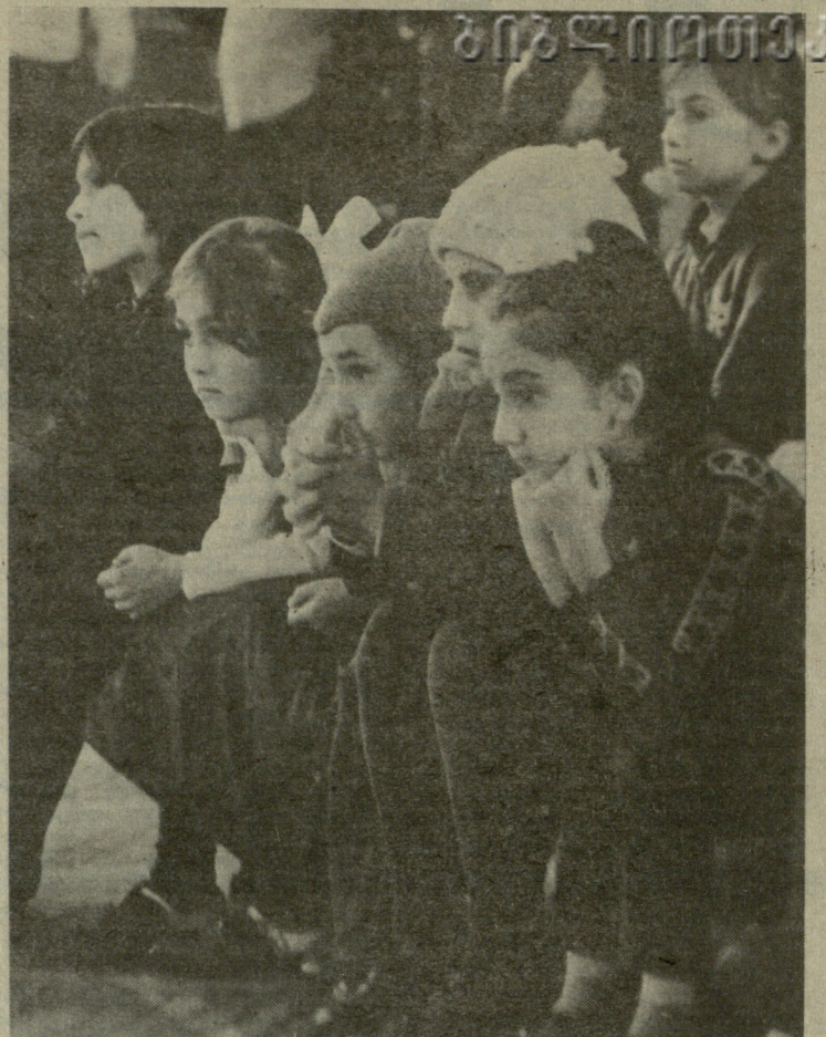
პირის ღრმად ჩაკვრა განიზრახა, სიციარიელე რჩება ხელთ.