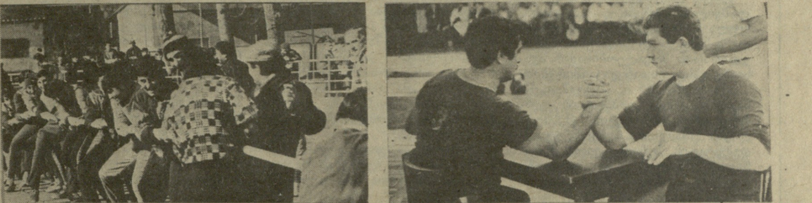
დღეს და ხვალ

მთელს ჩვენს რესპუბლიკაში ბარდობა მსოფლიო-გამაჯანსაღებელი ღონისძიებაში. სპორტულ ბაზაზე, კულტურისა და დასვენების პარკებში, მსოფლიო ბატონობა-დასვენების ადგილებში მოაქვთა შეჯიბრებაში ყველასათვის ხელმისაწვდომ სპორტის კლასიკურ და პროფესიულ სახეობებში, პროგრამაშია აზრითვე მართალი ხალხური თამაშები, მსოფლიო ბარდობაში, მხიარული სტარტები... განსჯილი! სოფთა პარკე ბატონობაში დრო აუცილებელია თქვენი ჯანსაღობისათვის.