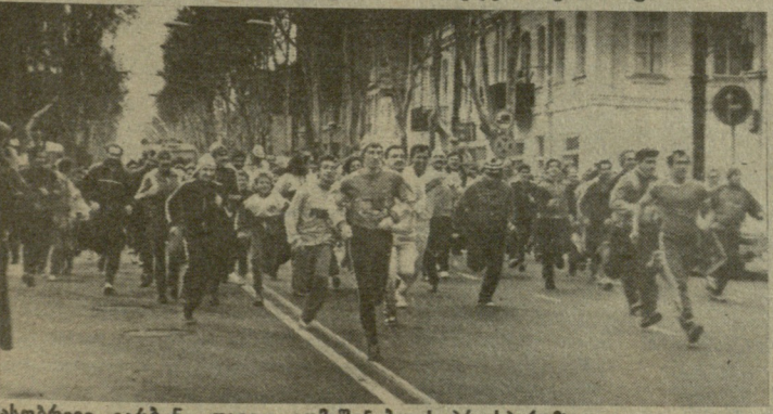
მასობრივი გარბენი დავით აღმაშენებლის პროსპექტზე.

სპორტული სეზონის გახსნის დღე-ებში მიმდინარეობს კიდევ ერთი საინტერესო მძლეოსნური შეჯიბ-რება, ოლეგ ივი წმინდა სპორ-ტული იქნება — გუშინ საქართვე-ლოს პროფსაბჭოს მძლეოსნობის სასახლეში დაიწყო საქართველოს მოსწავლეთა ჩემპიონატი.