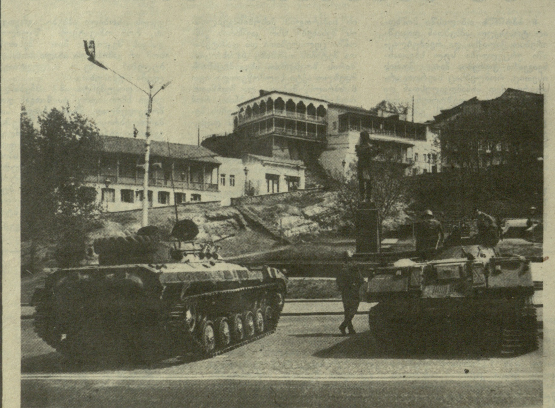
თბილისში ამ დღეებში.

რამდენადაც უფრო რთულია მდგომარეობა უმაღლეს სასწავლებლებში. მაგალითად, ნაწილობრივ შეცდინება ეწყობა მხოლოდ სამედიცინო ინსტიტუტსა და უცხო ენათა ინსტიტუტში, საქართველოს პოლიტექნიკური ინსტიტუტის კათედრებზე და ლაბორატორიებში. რესპუბლიკის ქალაქების უმაღლეს სასწავლებლებში სტუდენტების ლექციებზე დასწრებამ შეადგინა 60-90 პროცენტი. ყველა უმაღლესი სასწავლებლის პროფესორები და მასწავლებლები სამუშაოზე არიან და ახსნა-განმარტებლის მუშაობას ეწყვიან სტუდენტებთან.