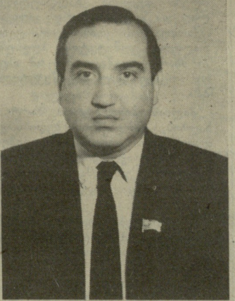
ვიპი გრიგოლის ძე გუმბარაძე დაიბადა 1945 წელს ქალაქ თბილისში, ქართველი, სკკპ წევრი.

საქართველოს კომპარტიის ცენტრალური კომიტეტის პირველი მდივანი