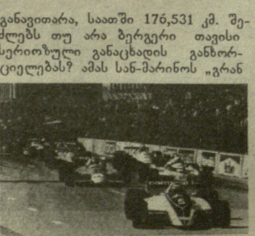
განავითარა, საათში 176,531 კმ. შეძლებს თუ არა ბერგერი თავისი სერიოზული განაცხადის განხორციელებას? ამას სან-მარინოს „გრან

ავტოსპორტის მოყვარულებმა იციან, რომ დღეს, სან-მარინოში, გაიმართება „ფორმულა 1“-ის კლასის ავტომობილის რბოლაში მსოფლიოს 1989 წლის ჩემპიონატის მეორე ეტაპი. იმოდის ტრასაზე უკვე ჩატარდა საკვალიფიკაციო რბოლები, სადაც საუკეთესო შედეგი ჰქონდა ავსტრიელ გერპარდ ბერგერს, რომელიც „ფერარის“ გუნდის სახელით ასპარეზობს. მისმა მანქანამ მაქსიმალური სიჩქარე