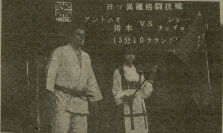
შეხვედრის წინ. ქართველი ფალანგის წარდგენა!