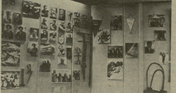
ქართველ ალბინისტთა ნადავლი საქართველოს სპორტის მუზეუმში.