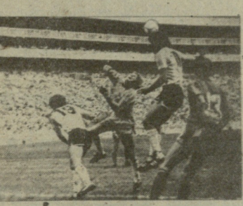
პელები ბრაზილიის ნაკრებს ოცი-ცალიურად გამოეხიზნა 1971 წელს, 1974 წელს კი გამოემუხღობა თავის მშობლიურ „სანტოსის“ და ნიუ-ორკის „კოსმოსში“ გადავიდა, სადაც 1978 წლამდე ითამაშა.

აქვე, ახლოსაც ვერ მიუახლოვდებიან სტადიონს. ჩვენ კარვად ვაგროვალისწინებ შეფილში მოხმობილ ტრაფიკს და ვიცით, რომ უბედურათა მასა, ეს უშუალო მხედრითა სტადიონისთვის. ბილეთების მკაცრი კონტროლი დამწყება სტადიონთან საკმაო რიგობრივით, მაგრამ იქვე მახლობლადაც გამოვინახავთ შესაფერის შენობებს, სადაც დავამონტაჟებთ დიდი ზომის ტელევიზორებს, ვინც სტადიონზე ვერ შევა, ამ ტელევიზორით დაიკმაყოფილებს თავის სურვილს.