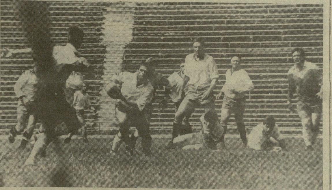
ეს დღეებია, თბილისელ რაგბის მოყვარულებს მოცლა არა აქვთ — თითქმის ყოველდღე იმართება უმალღესი და პირველი ღივების გუნდების მატჩები. ამ სურათზე „თბილისური რაგბის კვირეულის“ ყველაზე საინტერესო მატჩის — „ელმზავალი“ — სხა მომენტია ადებედილი. (იხ. მე-4 გვ.)