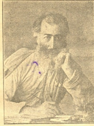
ა. ლ. შ ა ზ ბ ა ზ ი (1847—1893)

ხევის ბატონის გავლენიან ოჯახში დაიბადა, დიდრატულად ზრდიდნენ, საგანგებოდ ასწავლიდნენ, „საიდიაკოვ“ ამზადებდნენ, მაგრამ მან სიყრმიდანვე მდაბიო ხალხის ოფლით სწრაფად ისურვა და მშრომელი ხალხის ყოფა-ცხოვრების მწარე ამბავით გული დაიკემსა.