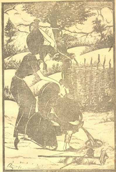
სოფლის სურათი: ღვინის გადაღება

ჩვენ სამკოთა საქართველოს მ-პალაქენი დიდ კულტურულ აღორძინების წინ ვსდგევართ. ხალხმა