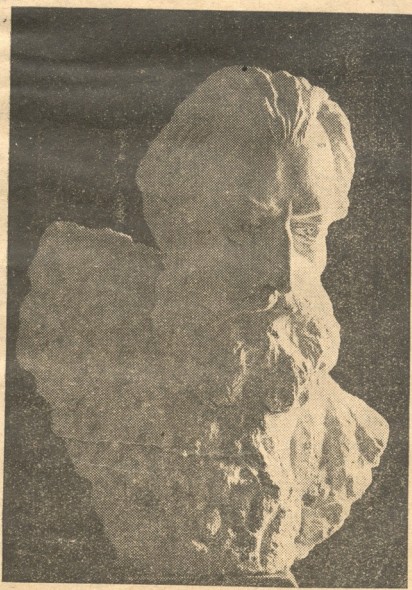
აღ. შაჰზაძის (1847—1893)