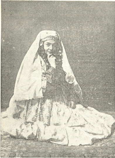
6. ვახუშტა-ცაგარლისა (ქაიქაიან-ს რეაქცია)