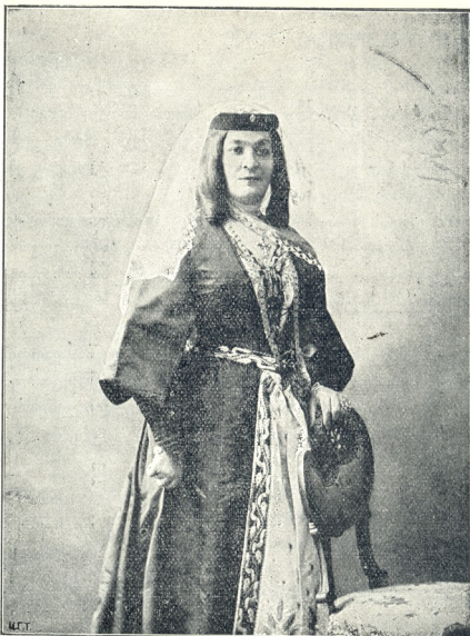
6. მ. გაბუნია-ცაგარლისა უკანასკნელ ხანში

ვიცხე როგორ იმოქმედა ნატო გაბუნია გარდაცვალებამ: