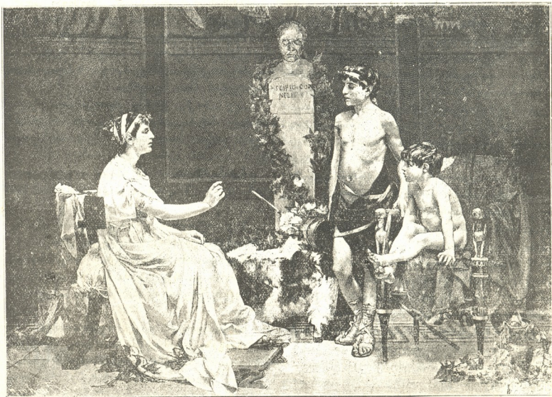
კორნელიაშხანიანივი დედა რომის მოქალაქეთა ტიბერიუს და კაიუს გრაკებისა.

შვილებს უქადაგებს ქვეყნის და ერის სამსახურსა.