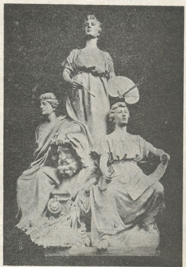
მხატვრობა, ქანდაკება და ხუროთმოძღვრება