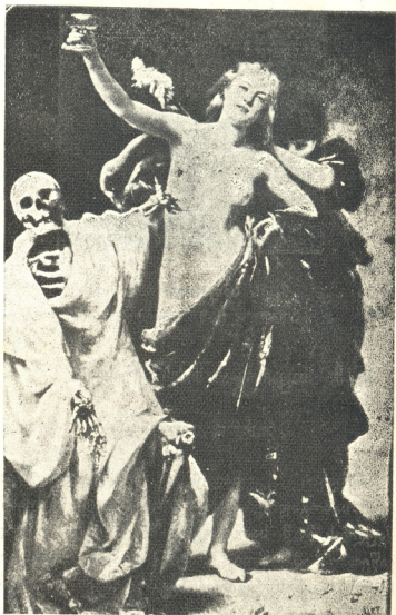
ახალგაზღობა და სიკვდილი ლიუბის ნახატი