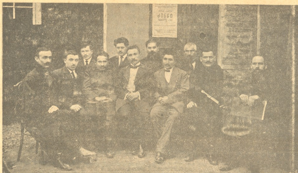
საბურთალოს თეატრის გამგეობა, რომელმაც 15 თებერვალს აკურთხებინა თეატრი და სეზონი დაიწყო