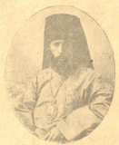
ქ ი რ ი ო ნ ი