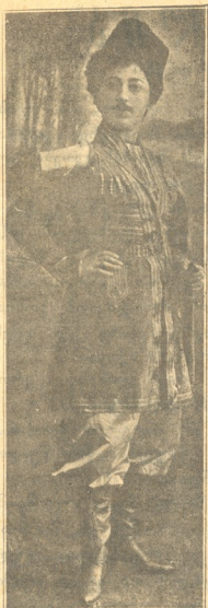
შახინობქალი ნ. გამრეკელ - თორელი

პატარა კახის როლში, სამსახიობო მოღვაწეობა დაიწყო 1906 წ. ბაკოში და ადგილობრივი ქართული სცენის აღორძინებას დიდად შეუწყო ხელი.