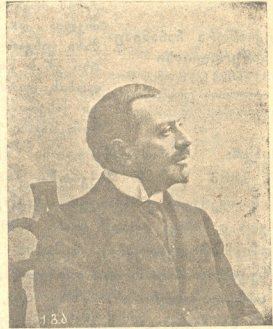
თავ. დიმიტრი ერასტიძე ჩოლოყაშვილი თბილისის გუბერნიის თავ. აზნაურთა წინამძღოლისა თანამდებობაზე არჩეული.