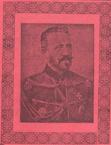
მ. ი. უ. ღიღი მთავარი ნიკოლოზ ნიკოლოზის ძის ფატი შიდეგულესობის შოადგილედ და კავასიის ჯა- რის მთავარ-სარდლად დანიშნული 23 აგვ. 25 აგვ. სალამოს 6 საათზე გამოეგზავრა საქართველოს.