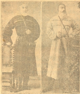
ბოდანდელი წინანდელი † თავ. იასონ დავ. გელოვანი (ორმოციან შერსულემის გამა)