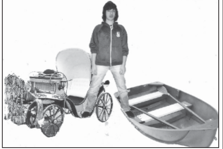
თამარ ხოდანელის ფოტოკოლაჟი