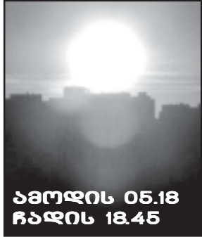
ამოდის 05.18 ჩადის 18.45