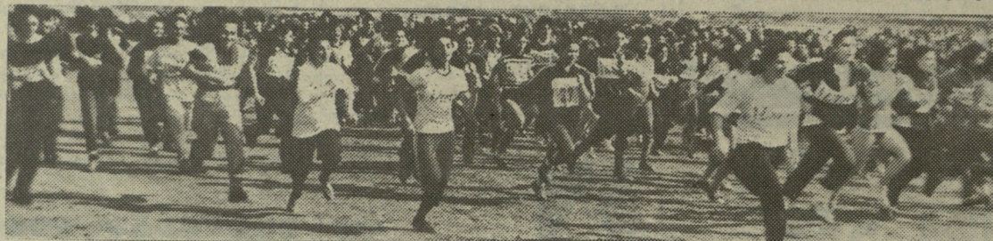
დღეს საუბარი გვექნება გამაჯანსაღებელ სიარულსა, ძუნძულსა და რბენაზე.

ამტანობა გამოიწვევება ციკლური, ანუ უწყვეტი ვარჯიშით. ასეთებია: სიარული, ძუნძული, რბენა, ველოსიპედით სიარული, ცურვა, ამრიგად, ადამიანმა ამტანობა და ამით ჯანმრთელობა რომ გაუმჯობესოს, საჭიროა სპორტის ერთ-ერთ ზემოთ დასახელებულ სახეობაში დაიწყოს ვარჯიში.