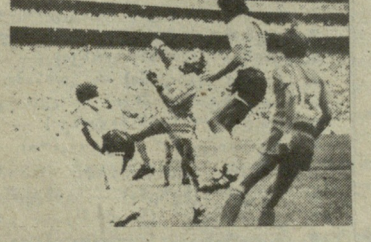
შედეგებით სუსტდება. საამისო მგალობლები საკმაოდ, რად ღირს, თუნდაც ის, რომ წყევლებდნენ...