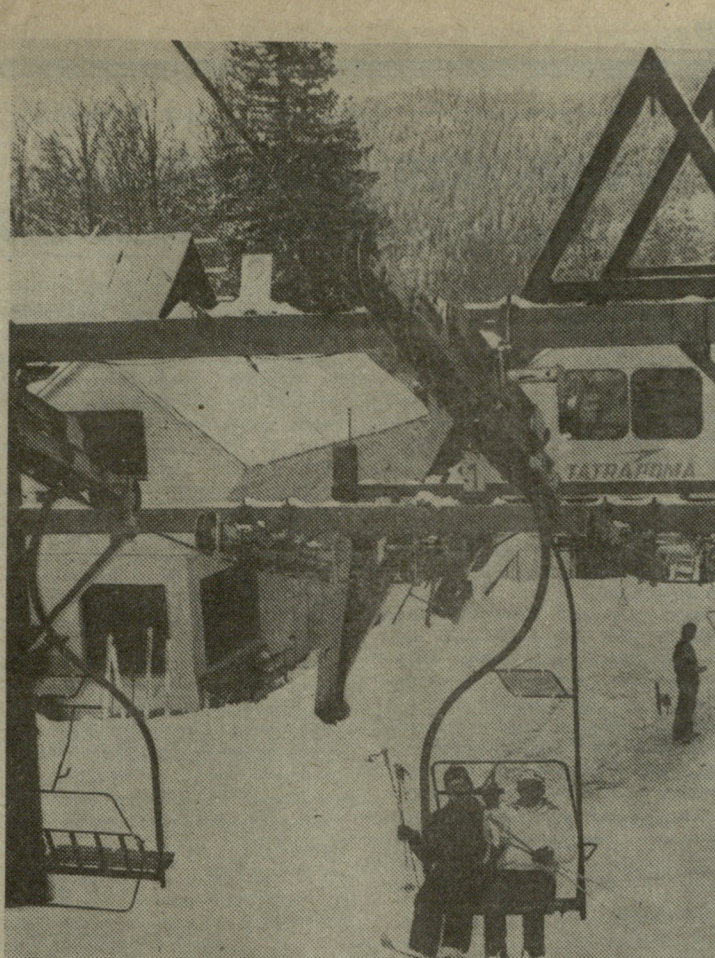
„ბაქურიანი-98“. ამ პატივითადაც აქცინის მიზანია საკუთარი თავის იმედით, საკუთარი სახეობით, საკუთარი ენაობით კეთილმოგავსოთ ბაქურიანი, ბავაშვანოთ და ბავაშვანოთ ისე, რომ 1998 წლისათვის ჩვენი „თეთრი ზარბალიტი“ არაფრით ჩამოუვარდებოდეს ზამთრის ოლიმპიურ ცენტრამს. შეგახსენებთ, რომ საქართველოს მთავრობის დადგენილებით 1990 წლიდან საქართველოში გატანადგება საბანგაბო ლატარა — „ბაქურიანი-98“.

ავტორების თხოვნით ამ წერილის პონორარი გადაირიცხება „დიდი ბაქურიანის“ განაწილების ფონდში.