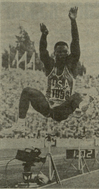
სურათი: კარლ ლუისი

ნი მოხვდა საუკეთესო ათლეტში — უროს მტყორცნელები იური სედიხი და სერგეი ლიტვინოვი.