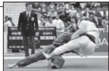
სამზადებელი ტემპი არასაკმარისად მიიჩნევა და შეჯივრების მასპინძლობის უფლება პარიზს გადაუღო...