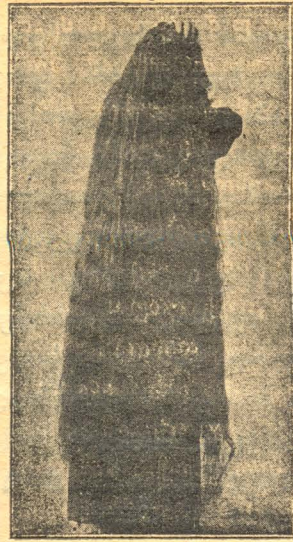
ქართველი ქალის თმა