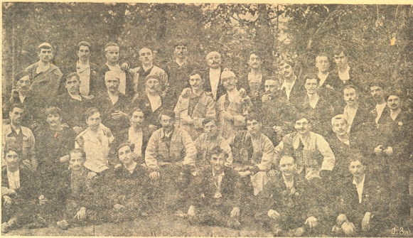
თბ. ქართ. მუშათა მომღერალ-მგალობელთა გუნდი დღევანდელ კონცერტის გამო