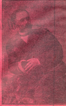
ზიო მღვიმელი (ამბროლო მოღვაწეობის 30 წ ლებს გამთა)