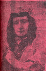
ლ. ჩერკეზი შვილი სასტუჯო მოღვაწეობის წაულის ვაიმე 2 თებერ.)

მიიღება ხალის მომარა 1916 წ. შურ თეატრი და ცხოვრება (წელიწადი მეოთხე. (იხ. შუ 2 გვ.)