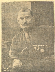
ალექ. გიორგ. ალქისიძე

ცნობილი მოცეკვავე, 1895 წ. პარიზში იყო გამოფენაზე და ჯილდოც მიიღო, 1896 წ. შემდეგ სახაზინო თეატრში მონაწილეობს. ინოჩენცის ცეკვის სკოლაში ასწავლის ყოველგვარ ცეკვას. მეორე ჯილდო მიიღო ბუხარის ემირისაგან.