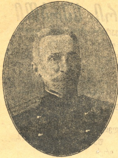
მწერალი დავით კლდიაშვილი ავადმყოფობის გამო