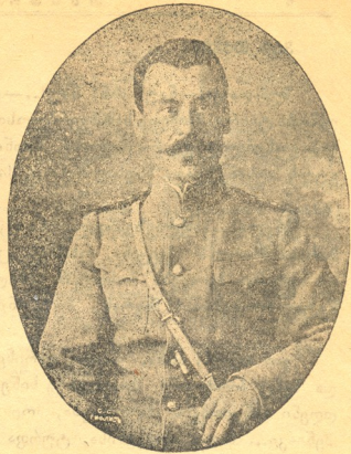
გმირი—კაპიტანი იოსებ დავითის ძე ყანჩაველი ლევის იქით, სოფელ კორევიტთან გმირულ ბრძო- ლაში მოკლული 1915 წ. 22 მაისს.

.. და ზედ ჯვარი მოსჩანდა... ჯვარზედ უსულო გვამი თითქოს ისევ ფიქრობდა... ფიქრობდა რაღაცაზე... ყოფნის ამოცემა .. სიცოცხლის გე'ლი.. შხამი... შავად იხატებოდა ბინლით მოფენილ ცაზე... ტიროდა ღვთის მშობელი... ტრემლდგნს ღვ'იდა ცხარეს... ტიროდა... ქვეითინებდა, იწეწდა კავ-დალაღებს... ეძინა მიღუმებულს ირგვლივ არე-შარესა და ცა, ბნელით მოცული, ოხვრით ხუჭავდა თვალებს... ბნელოდა... არც ვარსკვლავი... და არც მოსჩანდა მთვარე... უიმედოს, მწუხარეს მიწას ეძინებოდა... მხოლოდ გოლგოთის მთიდან ქვეითნი მწველი, მწარე, დაყრუებულს სამყაროს ობოლად ეფინებოდა .. ილ. მისაშვილი