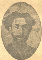
ირ. ევლოშვილი 1900—1905 წლებში