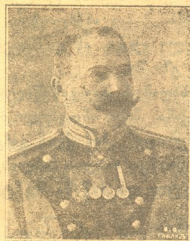
თავ. კ. ნ. აფხაზი