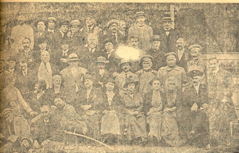
მონაწილენი 1916 წ. 18 მაისს „ნახალი კლუბის“ ბაღში

ფიქრებს თუ არა, სიმშობღაში დაბრუნდეს და მრ. სხ. კათხა აღმუქრს, რომელთა გამოსარევე ვად, რაგორც იქნა, უკანასკნელ წარმოდგენის დროს 1 ივნისს ვიხსენებ..