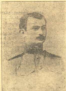
შტაბს კაპიტანი ივანე კონსტანტინეს ძე გუარამიძე

მოკლულ იქმნა 15 მაისს, 1915 წ. მდ. დუბისაზე გადასვლის დროს მისი მამაკუთრი მაგალითით წათამამებული ჯარი ყოველთვის იმარჯვებდა, რისთვისაც დაიმსახურა დიდი სიყვარული, გმირული სახელი და მრავალი ჯილდო,