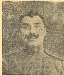
პრპ. დათიკო დიმიტ. ბზიავა თავ. ალექს. (ხანდრო) ჩიქოვანი (დაქარილი). (დაქარილი).